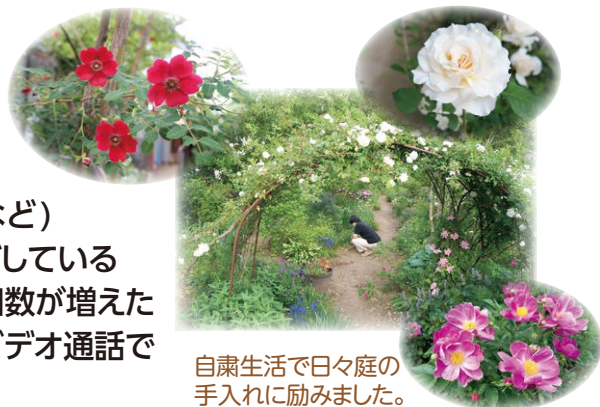
自粛生活で日々庭の手入れに励みました。