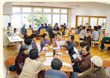
令和2年1月 さんでい講座