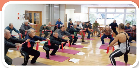
～“男性限定”運動講座～(令和2年2月上旬撮影)