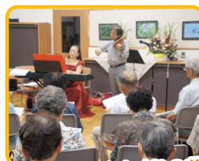
「歌声喫茶 かたくりの花」

こころ一句 思ひ切り 声張りあげて 歌ひおり 今日はたのしき かたくりの祭り 八月二十五日 かたくりのおまつりで 古見 山のこば