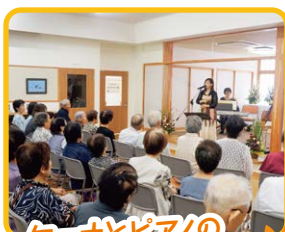
ケーナとピアノの優しい調べ

ご来場いただいた皆さまをはじめ、ご協力いただいた全ての皆さんに感謝申し上げますとともに、社協が目指す「安心していきいきと暮らすことのできる福祉の地域づくり」のためには、こうした多くの皆さんが関わりあい、人と人がつながっていくことがとても大切な一歩であることを、改めて感じさせられました。