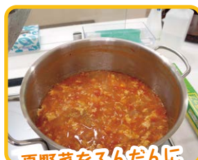
夏野菜をふんだんに使ったスープ